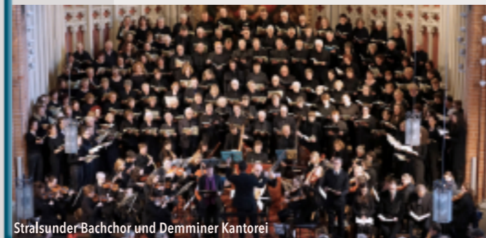
Stralsunder Bachchor und Demminer Kantorei